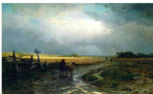
Васильев. После дождя. Проселок. 1867-1869